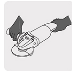
Operación a dos manos