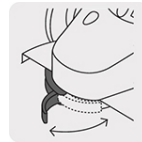
Guarda de ajuste rápido