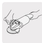
Operación a dos manos