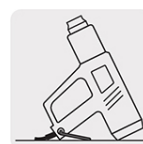
Soporte para trabajar a manos libres