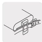
Clip para cinturón