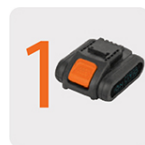
Incluye batería ion litio