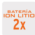
Más tiempo de vida Mayor velocidad de carga