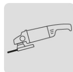
Para esmeriladora angular